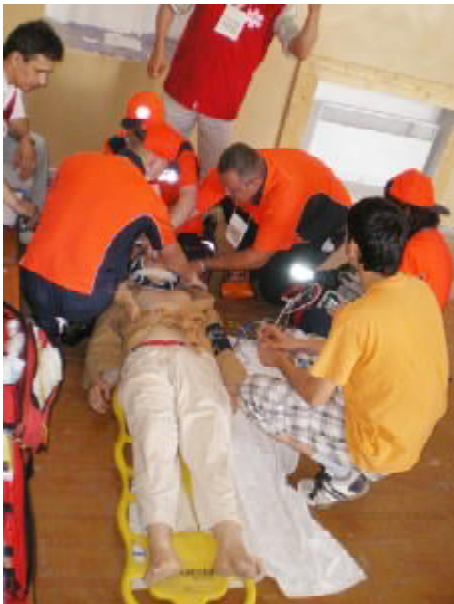
На конкурсі «Боєць»

На відкритті з вітальним словом до присутніх звернулися перший проректор