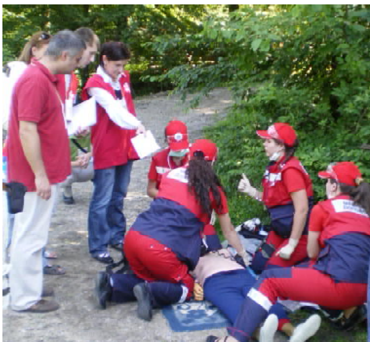
Виступає збірна команда Львівського і Тернопільського медичних університетів

спортівній школі східних багатоборств під час тренування хлопчик 14 років після удару в грудну клітку раптово впав, стан тяжкий), «Жертва кохання» (на залізничній станції «Тербовля» вагінній жінці раптово стало погано, різко підстрибнув артеріальний тиск, розболілася голова), «Сюрприз» (біля вулиця ви-