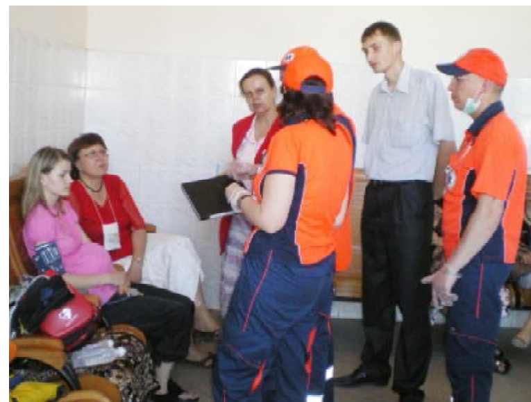
Судді ставлять завдання