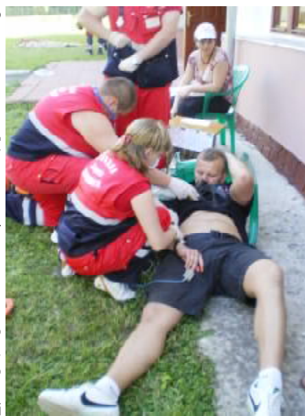
Оце так «Сюрприз»

Згодом відбувся парад учасників, які під звуки сирен