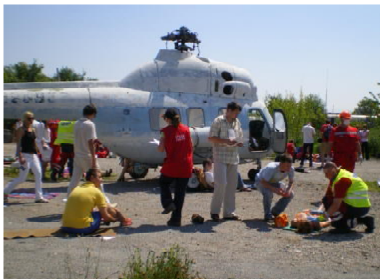
Конкурс «Помилка пілота»