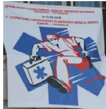
Я. Пайкуша «Українська рада реанімації: європейські перспективи».

У вечірньому конкурсі були запропоновані такі завдання: «Вуйко» (у велосипедиста 55 років виникла фібриляція шлуночків, він упав посеред вулиці, з пакету розсипалися продукти, розлилася олія), «Боєць» (у