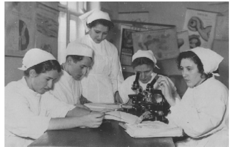
В навчальній аудиторії кафедри гістології (1958 р.)

На той час медичний інститут був першим і єдиним вищим навчальним закладом в обласному центрі, а ми були його гарячими патріотами. Розуміли, що від нас залежить, як виглядатиме вища освіта Тернополя, і намагалися представити інститут в