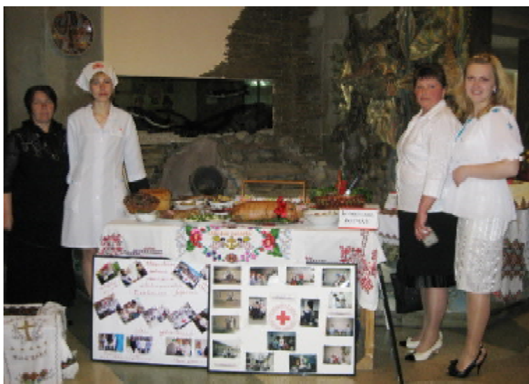
Конкурс кулінарних шедеврів працівників патронажної служби Борщівської районної організації

Яскравим та змістовним виявилось й домашнє завдання учас-