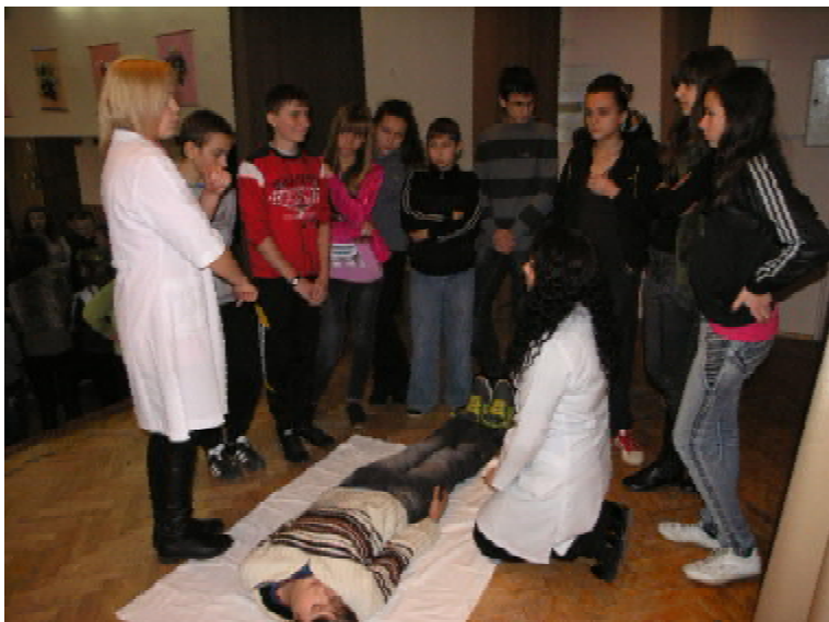
Студенти медфакультету навчають учнів наданню першої допомоги при зупинці кровотечі

полі. Побажання такі: розширити спектр навчальних тренувань і залучати до цього проекту більшу кількість школярів.