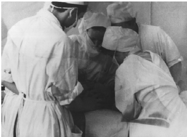
Під час виробничої практики в Чортківській районній лікарні (Липень 1961 р.)

Я не раз запитував себе: що ж об'єднувало всіх нас? Що робило недавно зовсім незнайомих