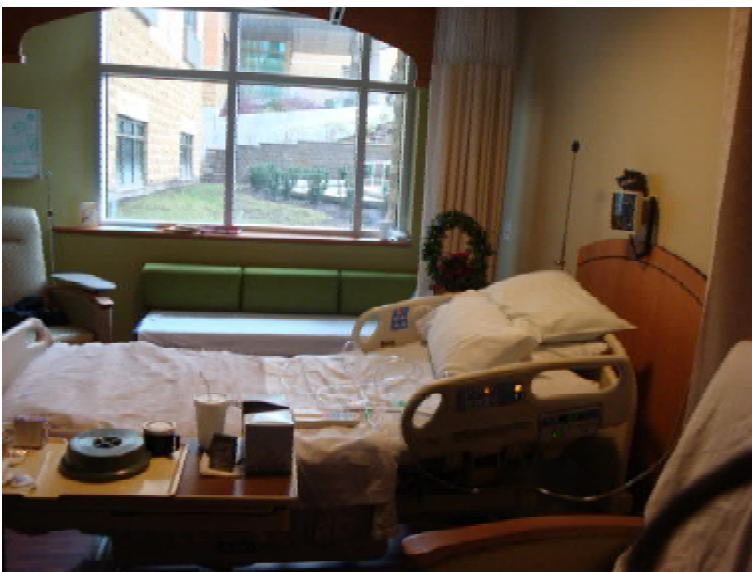
Функціональне ліжко з протипролизневим матрацом доступне кожному паліативному хворому безкоштовно

Тернопільському медичному університеті вже не перший рік переймаються проблемами хоспісної та паліативної допомоги, долучаючись до міжнародних, партнерських проектів у цій царині. Приміром, завдяки проекту МАТРА, за участю п'яти українських університетів та Саксонського університету в Голландії, представники нашого ВНЗ привернули увагу громадськості до проблеми догляду за людьми похилого віку.