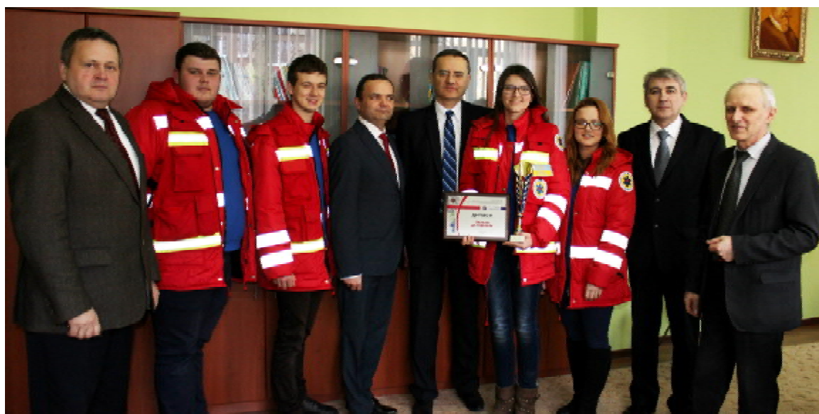
Під час зустрічі учасників чемпіонату з ректором ТДМУ імені І. Горбачевського, професором Михайлом Кордою

на «швидкій». Це — хлопці та дівчата у красивій ергономічній й безпечній уніформі на каретах «швидкої», оснащених з «голючки». Це — система уніфікованих протоколів і стандартів, заснованих на засадах доказової медицини, тому їх виконання на доказовому рівні гарантує рятування життя людини. Це — стовідсоткове забезпечення території вертолітною швидкою допомогою, це авіамедичні перевезення тяжких постраждалих у високоспеціалізовані медичні заклади країни та Європи. Це — відділення екстреної медичної допомоги при багатопрофільних лікарнях, де стабілізують «тяжких» з подальшою евакуацією у спеціалізовані відділення. Це — повага в суспільства та гідна зарплата.