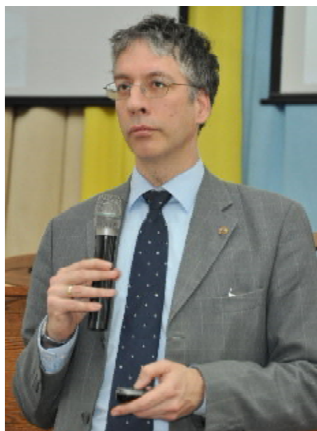
Професор Тімо УЛЬРІХС

Фундація Коха-Мечнікова здійснює свою діяльність у чотирьох важливих напрямках, один з яких стосується розширення наукової співпраці та реалізації програми наукових обмінів, спільних наукових публікацій. Наступним напрямком є розробка рекомендацій щодо належної діагностики і сучасних методів лікування соціально небезпечних захворювань. Фахівці фундації консультують органи місцевого самоврядування обласного й місцевого рівня. Налагодження співробітництва в цьому напрямку відкриє нові перспективи у подоланні туберкульозу і для нашого краю. Крім того, діяльність фундації Коха-Мечнікова стосується й впровадження програми академічних обмінів для студентів і