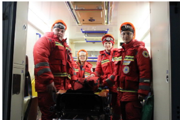
Після першого конкурсного завдання

Ця перемога, на мій погляд, стала революційною. Бо вже з 1 вересня 2007-2008 навчального року вперше в Україні почали викладати на базі кафедри ме-