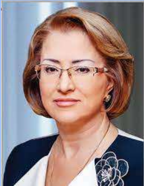
Наталія Вячеславівна Харченко

д-р мед. наук, професор, член-кореспондент НАМН України, Заслужений діяч науки і техніки, завідувач кафедри гастроентерології, дієтології та ендоскопії Національного університету охорони здоров'я України імені П. Л. Шупика (Київ)