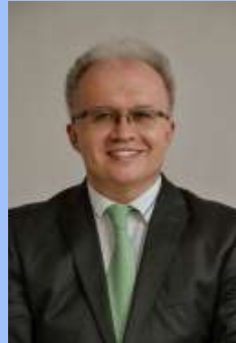
Ігор Миколайович Скрипник

д-р мед. наук, професор, член-кореспондент НАМН України, Заслужений діяч науки і техніки, завідувач кафедри гастроентерології, дієтології та ендоскопії Національного університету охорони здоров'я України імені П. Л. Шупика (Київ)