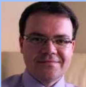
Мирослав Вуясінович Miroslav Vyasinovich професор гастроентерології Каролінського інституту у Стокгольмі, Президент Скандинавського та Балтійського панкреатологічного клубу ( Швеція)